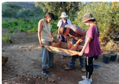
Crivagem dos sedimentos recolhidos.