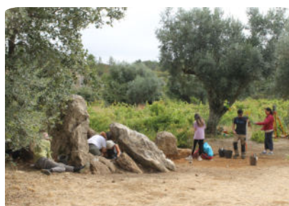
Anta de Azurrague, vista de sul.

Informações sobre a equipa e outras informações sobre o projeto podem ser consultadas na página da CAAPortugal https://www.caaportugal.pt/projetos , uma das entidades coordenadoras do projeto.