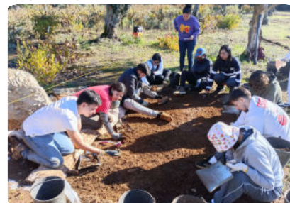
Equipa internacional em trabalhos.