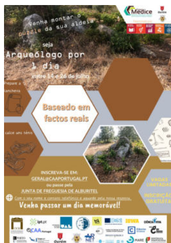
Arqueólogo por 1 dia