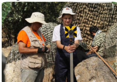
Levantamento com Estação Total das estruturas e coordenação de objetos