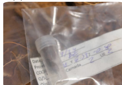
Etiquetagem e acondicionamento de materiais - caso de um dente humano.