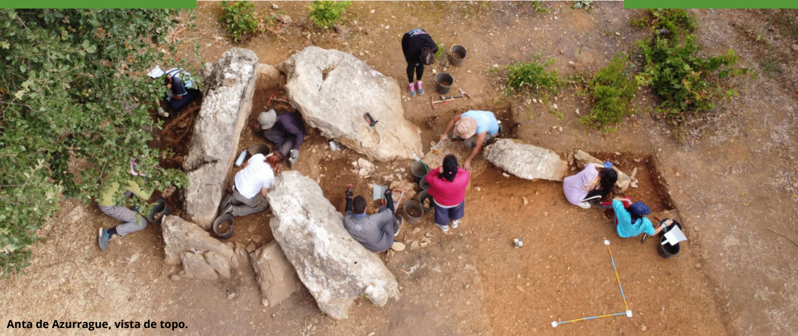
Anta de Azurrague, vista de topo.