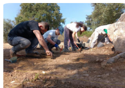
Arqueólogos em escavação, corredor.