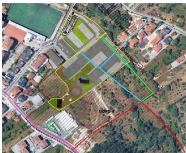
A cor azul - arruamentos a sofrer alteração; A cor verde - proposta de adequação/modificação da rede viária