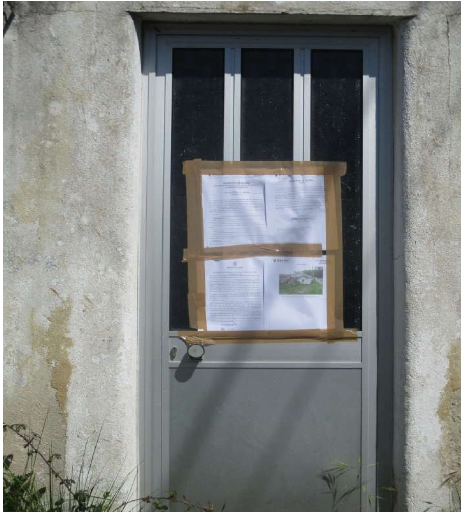
Rua Cidade de Ourém nº 250 Abadia - Caxarias