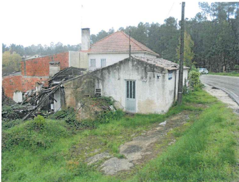
Foto 1 – Vista geral da edificação, podendo verificar-se o anexo em fase avançada de ruína.