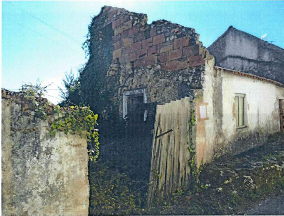
Foto 3 – Vista da ausência de guarnecimento de vãos, permitindo o acesso ao interior.