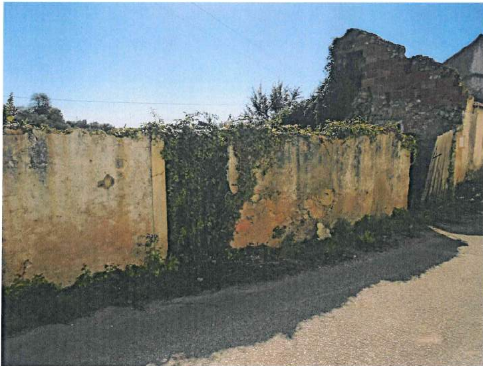
Foto 2 – Vista parcial da fachada da edificação, confinante com a via pública.