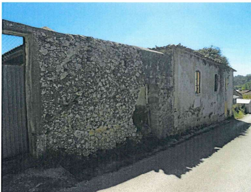
Foto 2 – Vista da fachada da edificação, confinante com a via pública.