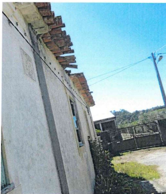
Foto 2 – Vista da fachada da edificação, confinante com a via pública.