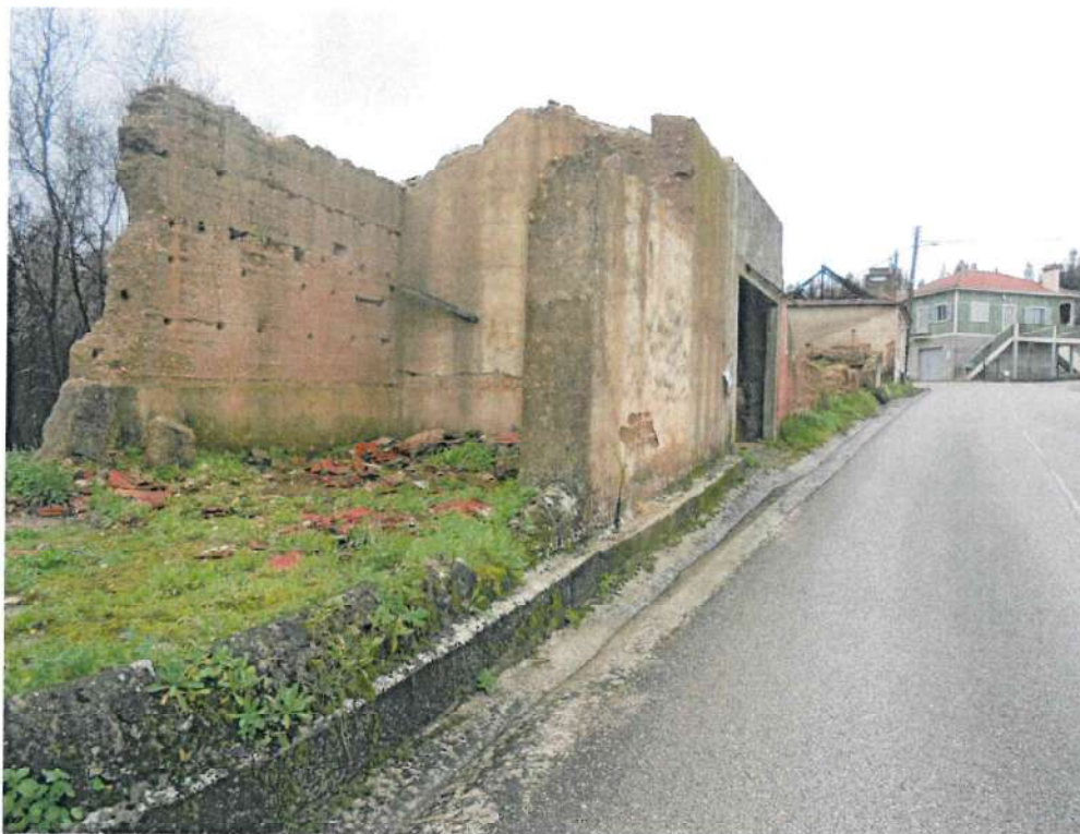
Foto 1 – Vista geral da edificação, onde se visualiza a ruína avançada da construção e o risco para a via pública.